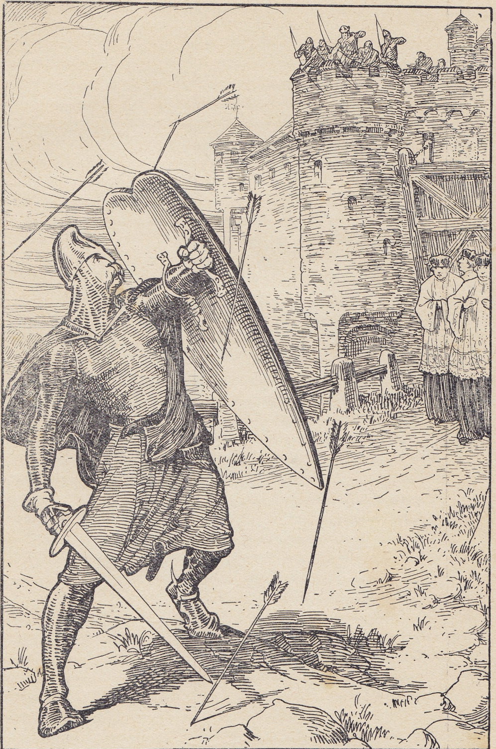
Gedurende eenige oogenblikken was de zwarte jager het mikpunt der hand- en voetboogschutters (blz. 176)